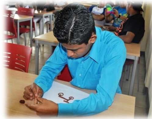
Joven expresa su pasatiempo con plastilina