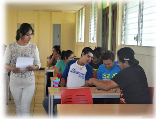
Replica de taller de ideas