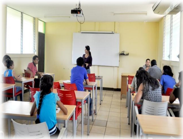
Jóvenes exponen sus ideas con plastilina