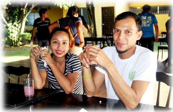
Jóvenes disfrutando de un pequeño refrigerio